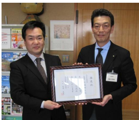
3/13 推薦状交付:知事室にて 荒木会長と知事室長岡本天津男氏

広瀬氏は、知事として「健康寿命をのばす。」と宣言され「高齢者の元気作り」を積極的に進めています。「障害者実雇用率トップ」「子育て満足度日本一」を掲げ県政を推し進めています。