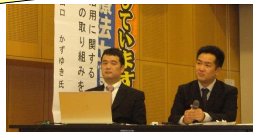
協定内容に関する活動について検証!

特別支援教育に関して作業療法の有用性に鑑み、作業療法士の学校教育参画と配置を促進すること