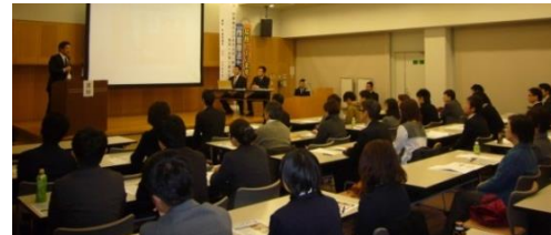
「作業療法士の立場は今のままで良いのか？」と投げかけられる参加者