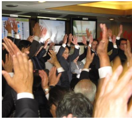
4/12 開票見守り会へ参加 「開票と同時に当選確定」