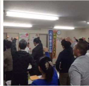
4/20「個人演説会」 大分県作業療法協会ビル